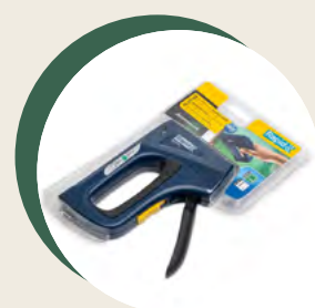
Agrafeuse manuelle 740