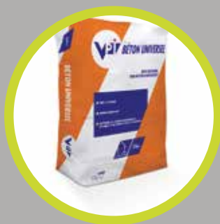
Béton prêt à l'emploi